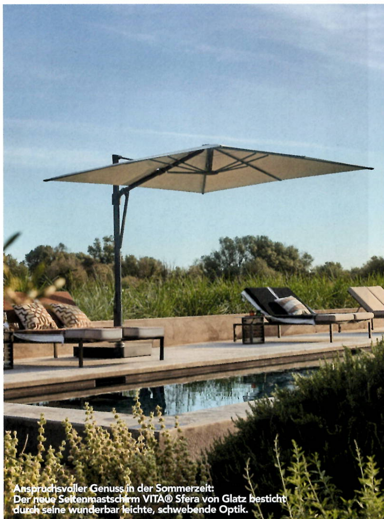
Anspruchsvoller Genuss in der Sommerzeit: Der neue Seitenmastschirm VITA® Sfera von Glatz besticht durch seine wunderbar leichte, schwebende Optik.

Wer das Besondere für anspruchsvolle Außenbereiche sucht, sollte die exklusiven VITA® Modelle für sich entdecken. Hervorragenden UV-Schutz bis 98 Prozent und Langlebigkeit gewährleisten alle drei durch ihre Bezugsstoffe in der höchsten Stoffqualität 5. Hergestellt mit der typischen Schweizer Liebe zum Detail, absoluter Präzision und einem hohen Maß an Handarbeit überzeugen diese Sonnenschirme durch ihre elegante, puristische Designsprache sowie durch ihre außerordentliche Benutzerfreundlichkeit. Sie lassen mit einer Stoffauswahl von 55 Farbtönen keinen Gestaltungswunsch offen und punkten mit ihren eleganten Gestellfarben in wahlweise Seidengrau oder Anthrazit. Die Hochwertigkeit wird verstärkt durch Lederecken an den flexiblen Strebenenden, durch die der Bezugsstoff immer gut gespannt ist. Eine Schutzhülle wird inklusive mitgeliefert. Für höchste Flexibilität und eine ideale Beschattung nach Sonnenverlauf sorgen optional erhältliche, elegante Rollensockel in passendem Seidengrau oder Anthrazit.