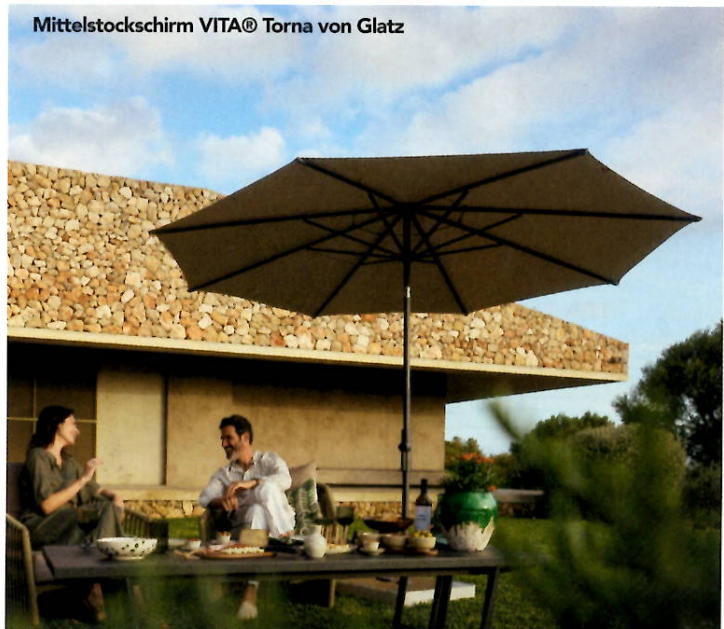
Mittelstockschirm VITA® Torna von Glatz

Die neue VITA® Collection ist ideal für individuell gestaltete Terrassen oder Gärten. Die Modelle sind bei ausgewählten Fachhändlern erhältlich. Diese beraten die Kunden auch umfassend zur Wahl des passenden Sonnenschutzes.