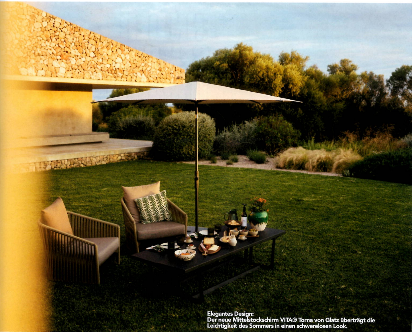
Elegantes Design: Der neue Mittelstockschirm VITA® Torna von Glatz überträgt die Leichtigkeit des Sommers in einen schwerelosen Look.