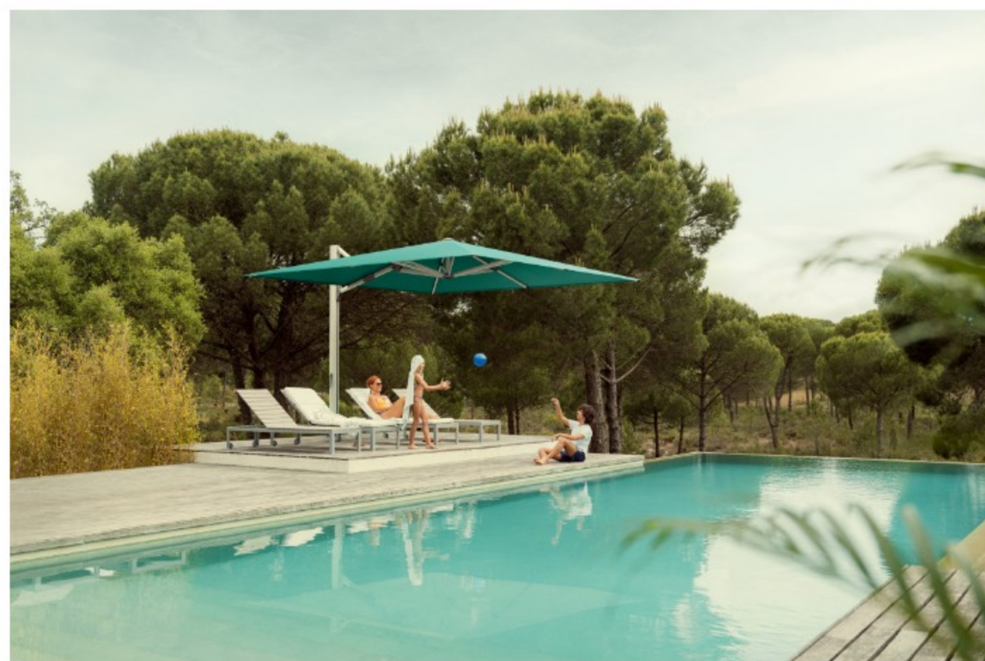
Der Farbton des Ampelschirms passt sich dem Außenbereich mit Pool an.

Den Schirm gibt es in quadratischen oder rechteckigen Formen . Der Schweizer Sonnenschirmhersteller Glatz setzt mit mehr als 75 Farbtönen auf große Flexibilität bei Ampelschirmen für Terrasse und Garten .