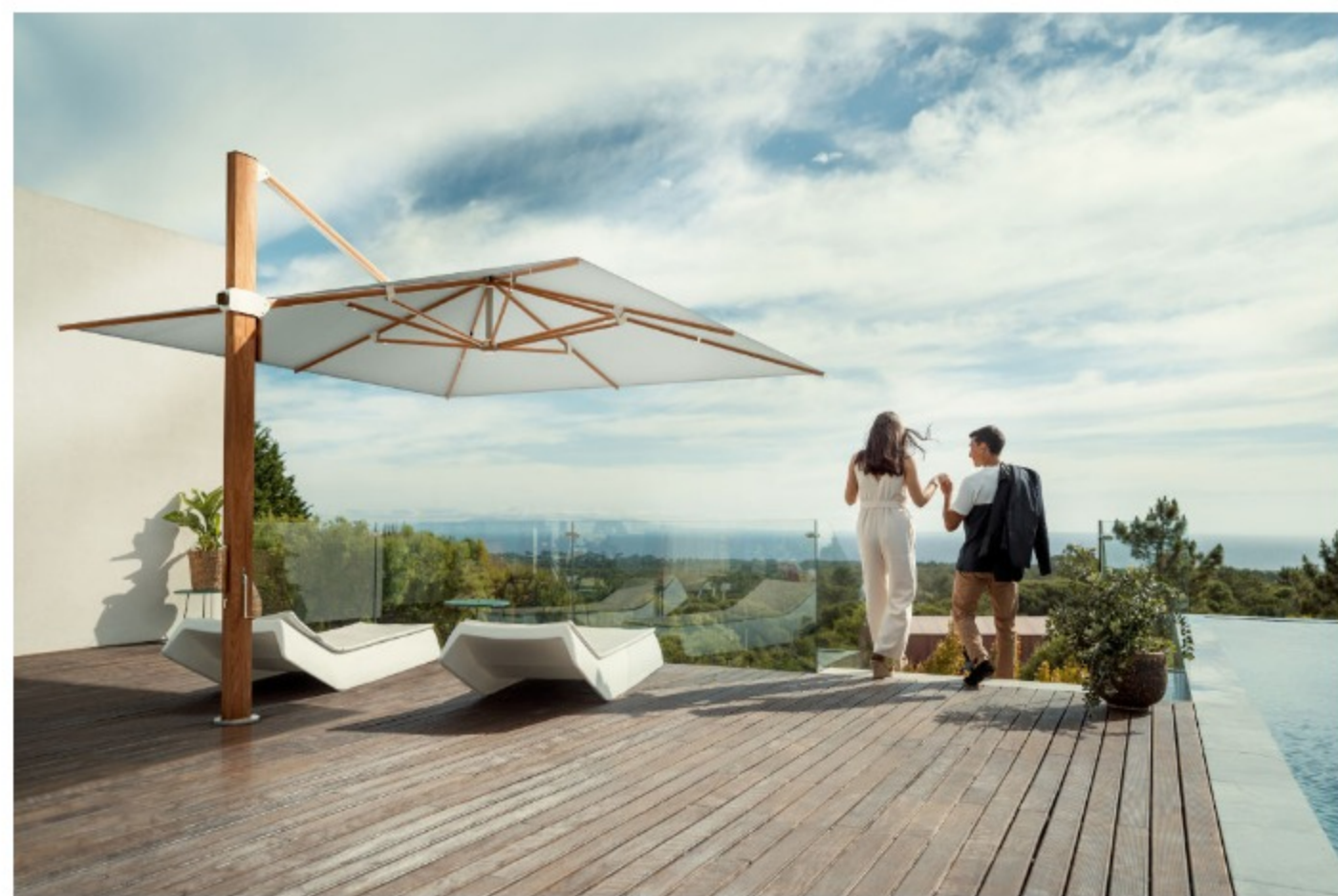
Der Ampelschirm mit robustem Holzmast, spendet durch die Größe des Schirmdachs reichlich Schatten.

Auch der Ampelschirm Pendalex P+ des Schweizer Sonnenschirmherstellers punktet mit einem Maximum an Beweglichkeit . Der mobile Sonnenschutz ist höhenverstellbar . Außerdem kann man das Dach einmal komplett um den Mast drehen und stufenlos beidseitig bis in die Senkrechte neigen. Sobald die Sonne gegen Abend sehr tief steht, wird der Sonnenschutz hier gleichzeitig zum Sichtschutz .