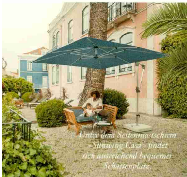
Unter dem Seitenmastschirm «Sunwing Casa» findet sich ausreichend bequemer Schattenplatz.