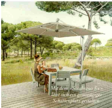
Mit dem «Sonnbuono S» lässt sich ein grosszügiger Schattenplatz gestalten.