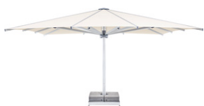
PZR PZN PZS Linea PALAZZO® Royal, Noblesse, Style