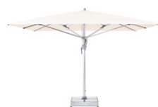
CAS CASTELLO® Pro Il versatile tuttofare per la ristorazione