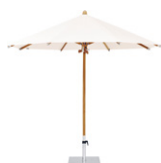
TW TEAKWOOD L'elegante capolavoro in legno pregiato