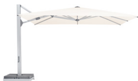
AMB AMBIENTE Nova Re degli ombrelloni con palo laterale