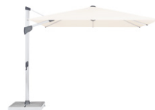
FA FORTANO® L'ombrellone con palo laterale resistente al vento