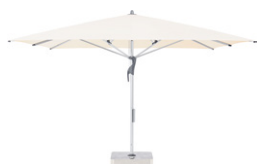
FL FR FI Linea F Fortello®, Fortero®, Fortino® Riviera