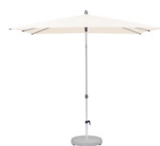
AS ALU-SMART Piccolo e adattabile