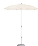
AL ALEXO® Il classico dal 1931