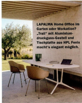
LAPALMA Home Office im Garten oder Workation? „Trail“ mit Aluminiumdruckguss-Gestell und Tischplatte aus HPL Fenix macht's elegant möglich.