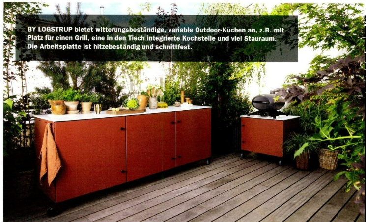
BY LOGSTRUP bietet witterungsbeständige, variable Outdoor-Küchen an, z.B. mit Platz für einen Grill, eine in den Tisch integrierte Kochstelle und viel Stauraum. Die Arbeitsplatte ist hitzebeständig und schnittfest.