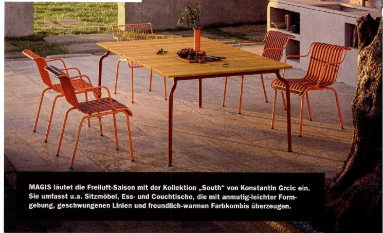
MAGIS läutet die Freiluft-Saison mit der Kollektion „South“ von Konstantin Grcic ein. Sie umfasst u.a. Sitzmöbel, Ess- und Couchtische, die mit anmutig-leichter Formgebung, geschwungenen Linien und freundlich-warmen Farbkombis überzeugen.

Es ist soweit: Jetzt wandern die Möbel wieder nach draußen. Eine tolle Entwicklung im Outdoor Living Markt: Immer mehr Premium-Hersteller bieten ihre beliebten Indoor-Modelle nun auch für den uneingeschränkten Einsatz im Garten, auf der Terrasse und dem Balkon an, so z.B. Freifrau, Janua und Draener. Noch attraktiver und individueller wird auch das Angebot bei Open Air Cooking, Sonnenschutz, Wellness und Licht (s. S. 50). Egal, ob im Privatbereich, der Hotellerie oder Gastronomie, so lässt sich das Leben unter freiem Himmel mit jeder Menge Komfort, Funktionalität und Wohnlichkeit wunderbar ausdehnen. Happy Summer Time 2024!