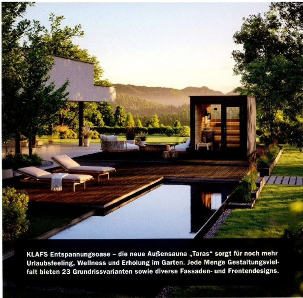
KLAFS Entspannungsoase – die neue Außensauna „Taras“ sorgt für noch mehr Urlaubsfeeling, Wellness und Erholung im Garten. Jede Menge Gestaltungsvielfalt bieten 23 Grundrissvarianten sowie diverse Fassaden- und Frontdesigns.