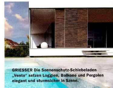
GRIESSER Die Sonnenschutz-Schiebeläden „Vento“ setzen Loggien, Balkone und Pergolen elegant und sturmsicher in Szene.