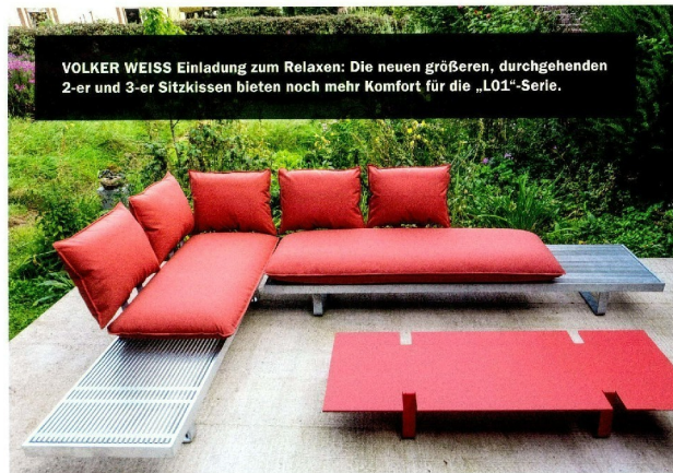
VOLKER WEISS Einladung zum Relaxen: Die neuen größeren, durchgehenden 2-er und 3-er Sitzkissen bieten noch mehr Komfort für die „L01“-Serie.