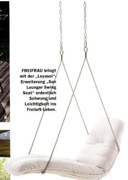
FREIFRAU bringt mit der „Leyasol“-Erweiterung „Sun Lounger Swing Seat“ ordentlich Schwung und Leichtigkeit ins Freiluft-Leben.